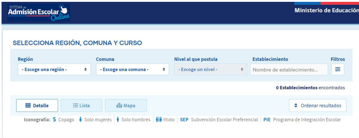
Ilustración 1. Buscador de establecimientos SAE

Además, la página permite visualizar los resultados en detalle, lista simple o usando la ubicación en el mapa. Con esta última función, por ejemplo, puede encontrar establecimientos que estén cerca de su casa, lugar de trabajo o en cualquier punto de la ciudad que le acomode. Por ejemplo, en el trayecto entre su hogar y el trabajo, cerca de algún familiar de confianza, o cerca del colegio de otro hermano o hermana. Recuerde la ubicación de su domicilio NO influye en su